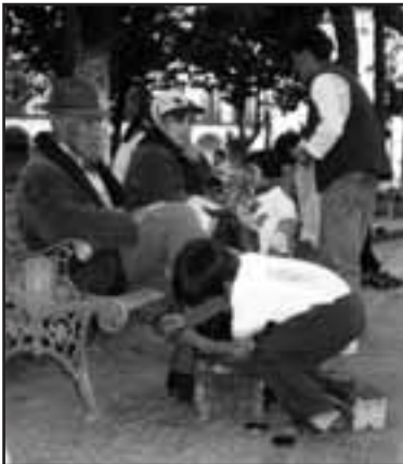
Schuhputzer in Bolivien