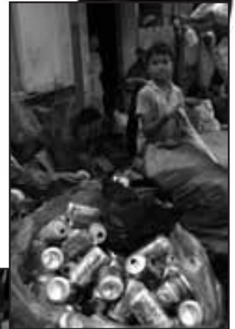
Müllsammler in Saigon