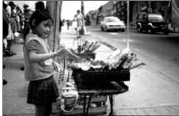
Mädchen verkauft Mais in einer Straße in Kolumbien