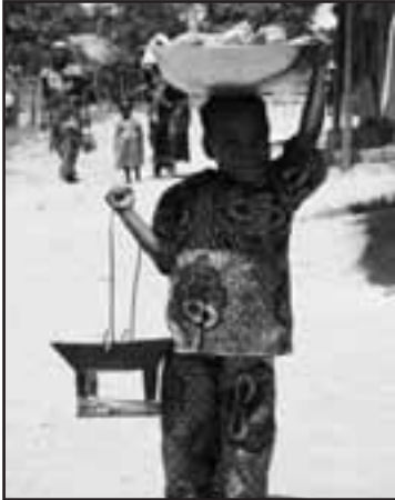
Kinderarbeiter in der Landwirtschaft (Kongo)