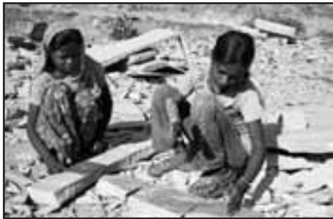
Kinder arbeiten in einem indischen Steinbruch